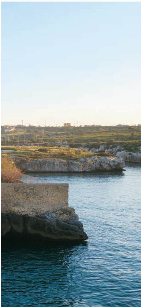
Panoramica del Faro di Brucoli a Siracusa, che si affaccia sul Mar Ionio e vista sull'Etna, soggetto ad un restauro 'di lusso' firmato da Studio Associato Itinera.